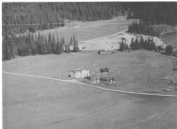
Tunet på Sakrismoen i 1963.