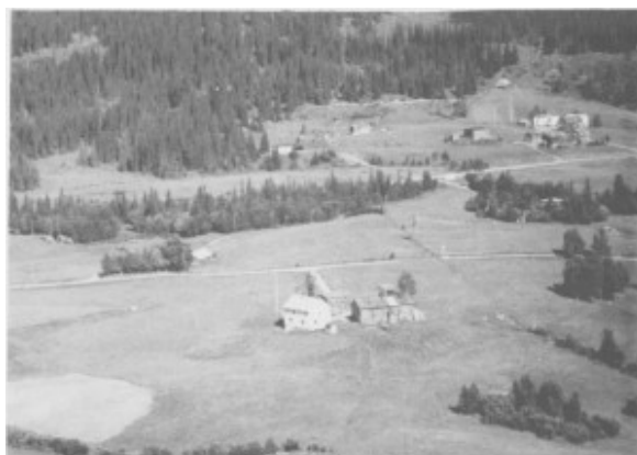
Husvold Nedre midt på bildet. I bakgrunnen til høyre Berggård Nedre og Berggård Øvre. (1963)