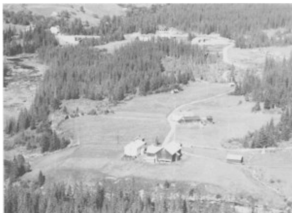
Kløften Vestre (nærmest) og Kløften Østre. Nea og Neabrua til venstre. (1963)

Av den opprinnelige innmarka på ca. 25 mål gjenstår i dag ca. 15 mål, etter at bruket ble fradelt grunn til idrettsplass (b.nr. 65) i 1977 og del av skoletomt (b.nr. 85) i 1990. Garden har beiterett i Ås fellesbeite. Innmarka er nå bortleid til Fastesgjardet. En skogparsell sør for Nea er på ca. 80 dekar.