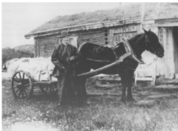
Ingebrigt Pedersen Løvøen med buføringslass ved Grønsjøvollen.

garden i 1960. I 1976 bygde de nytt våningshus på tunet.