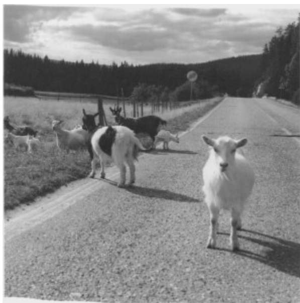
De siste geiter i Tydal? Geitost var en gang ei viktig salgsvare i Tydal, men geiteholdet har forlengst tatt slutt. Sau og ku er nå de eneste husdyra på gardene.

markedet. Siden slutten av 1970-åra har derfor tallet på mjølkebruk ligget noenlunde fast i underkant av 40. Kvotene har økt noe, og tallet på storfe og mjølkekyr har vokst etter en nedgang i 1960- og 70-åra. De som driver med kyr, har altså gjennomgående større buskap enn før. Vel halvparten har nå mellom ti og tjue kyr, men for de fleste gir ikke mjølkeproduksjonen inntekter nok til en familie.