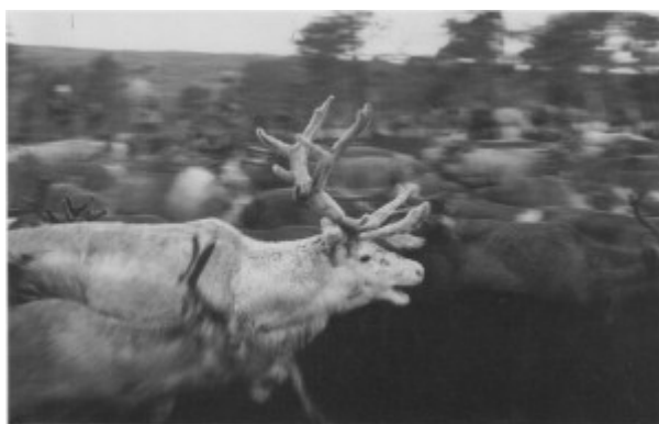
Reinsdyr i samletrøa ved Rødalen.

Samlinga for vinterflyttinga fra Essanddistriktet skjer nord og vest for Essand og Nesjøen. Under flyttinga har det blitt slakta mye i Spaklarslia i Stugudal, der det er bygd opp beitingstrø. Senere slaktes det ved Vigelen som er et godt trivselland for reinen. Fra Vigelen drives reinen fra Essanddistriktet til vinteroppholdet ved Langen. Riastreinen drives sørover etter at isen på Aursunden har lagt seg og har vinterbeita i områda nordvest for Femunden.