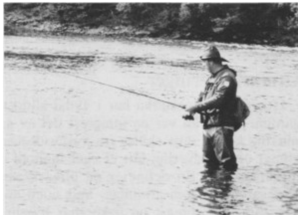
Fiskemulighetene lokker mange til Tydal. Her prøves fiskelykken i Fiskehølen i Tya.

Herlighetene i utmarka ble inntil vårt århundre først og fremst utnytta til eget bruk. Omkring 1900 begynte det å bli aktuelt å leie ut jakt- og fiskerettigheter, og det er nå salg av disse ressursene som betyr noe økonomisk. I 1966 gikk grunneierne sammen om å danne Tydal grunneierlag. Formålet var «på samvirkemessig grunnlag ... å utnytte grunneierens rettigheter på en etter langsiktig vurdering best mulig måte. Laget skal arbeide for godt vilt- og fiskestell etter næringsmessige prinsipper». Grunneierlaget ble en paraplyorganisasjon for etter hvert seks sjølstendige områder. I tillegg er det to foreninger, Moen fiskerforening og Stugudal fiskelag, som står utafor grunneierlaget. Etter lovene har laget full disposisjonsrett over medlemmenes innmeldte rådyrjakt-, småviltjakt og fiskerettigheter. Det organiserer salget av fiskekort, utleie av jaktterreng for storvilt og småvilt og salg av jaktkort. Medlemskap gjelder for fem år om gangen og overskottet for hvert år blir fordelt mellom medlemmene.