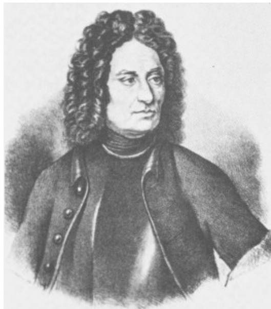
Carl Gustaf Armfeldt (1666 - 1736) var en av de mest betrodde generalene til kong Karl 12. under Den store nordiske krig. Armfeldt leda forsvaret av Finland mot russerne, og i 1718 fikk han i oppdrag å rykke inn i Trøndelag med 10.000 mann.

De som var barn og unge i 1678, fikk oppleve enda en krigskatastrofe i bygda. Det skjedde ved årsskiftet 1718-19 da general Armfeldt prøvde å føre troppene sine tilbake til Sverige over Tydalsfjella etter hærtoget i Trøndelag om høsten. Armfeldts retrett ble den største tragedien noen svensk armé har lidd. For tydalsbøndene førte gjennommarsjen til en ny ruin. Hvem som gjorde størst skade general Sparre eller Armfeldt er ikke godt å si. Men det er særlig Armfeldts hærtog som har gjort Tydals navn kjent i norsk og svensk historie.