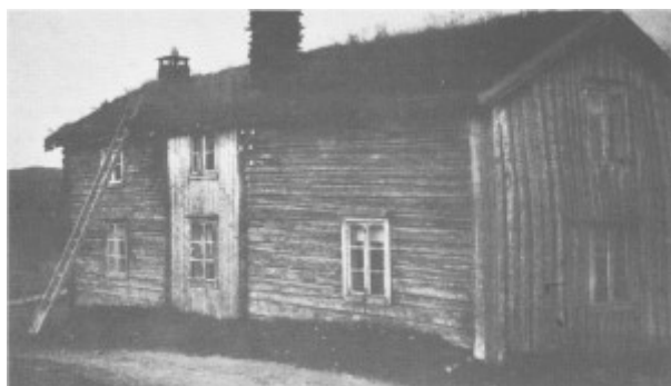
Stuebygninga på Gammalgarden eller Jensgarden som den hette før bruksdelinga omkring 1860. Etter tradisjonen tok Armfeldt inn her og bodde i stua til venstre på bildet.