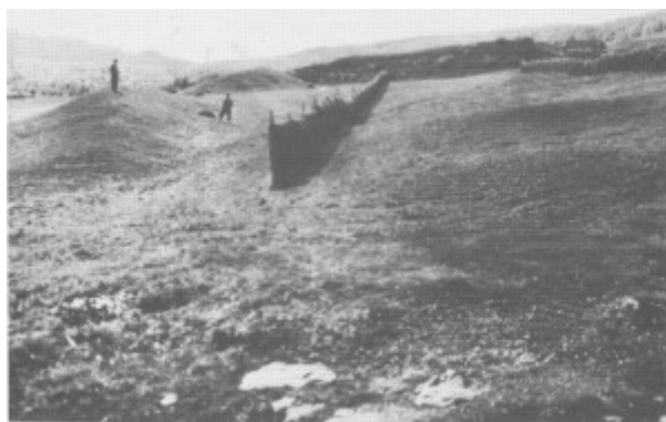
Skansen ved Stugudalsgarden var en forsvarsvoll som ble bygd i slutten av 1600-tallet. Lengste jordvollen var ca. 100 meter lang og fem meter