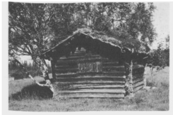
Denne høyløa står igjen på Kirkvoll, men er ikke lenger i bruk til sitt opprinnelige formål. Løa er trulig satt opp i slutten av 1700-tallet. Bildet er tatt i 1987.