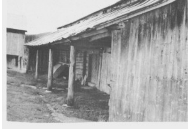
På den tidligere husmannsplassen Brekka (Stor-Brekka) kan en fremdeles se det karakteristiske «snetaket» i tilknytning til fjøsbygninga. Bildet er tatt i 1987.