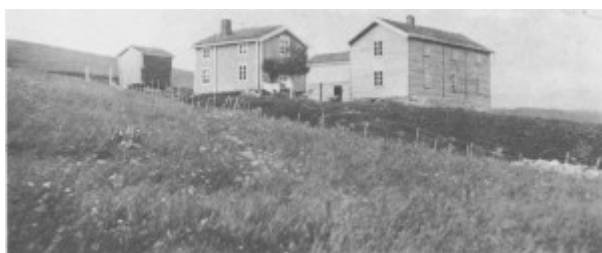
Bønsngarden med den nye hovedbygninga fra 1902 til høgre. Sommerstua til venstre for denne er bygd ca. 1850. Bildet er trulig tatt i 1903.

Hovedstua på Fossan sto praktisk talt tom om sommeren når den ikke ble tatt i bruk for gjester. Men i den rommelige sommerstua var det plass rundt matbordet for de ekstra leide onnefolka, og der var det også bedre plass for matlaginga i den store grua som de hadde i ildhuset ved siden av. Dette var kanskje en av grunnene til at folka på garden flytta dit om sommeren.