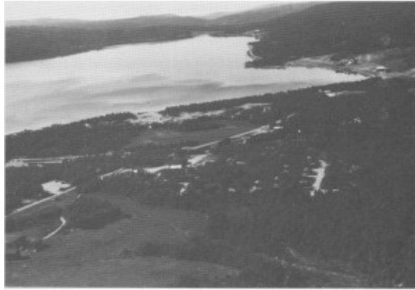
Flyfoto av Stugusjøen tatt i 1982. Til høyre ser en de to Stuguvollgardene.

Vi har tidligere vært inne på familie- og husholdningsstørrelse og funnet at de små husholdningene var vanlige. Husstanden besto av kjernefamilien pluss eventuelle slektninger og tjenestefolk. Endra dette seg på 17- og 1800-tallet, og ble husholdningene mindre eller større?