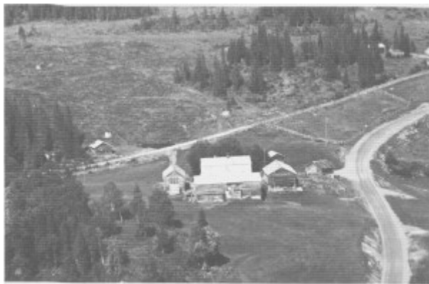
Flyfoto av Stor-Brekka tatt i 1963. Her bodde den første skolemesteren i Tydal Svend Hellein, midt på 1700-tallet. Eiendommen er gitt til Tydal kommune og er nå museumsområde. På bildet ser vi både gamlevegen (ovafor husa) og nyvegen.

Folketallsøkninga i første halvdel av 1600-tallet førte til at nedlagte gardar ble tatt i bruk og nye gardar rydda og bosatt. Slåttemarker og setervoller oppover mot Stugusjøen og høgare til fjells ble utnytta i et ekstensivt høstingsbruk. Vi så foran at husdyrholdet ved midten av 1600-tallet var svært stort. Det var da 20 gardar eller jordbruk i bygda. Dette tallet holdt seg lenge. Matrikelutkastet 1723 har med 21 bruk. Men etter den lange stagnasjonsperioden økte nå folketallet mye raskere enn før. Gardgrensene ble sprengt, og nye familier rydda seg bosteder på tidlige slåtte- og seterområder. Klokke Peder Hansens manntall fra 1762 viste at gard-delinga hadde økt. Det var da 33 husstander fordelt på 29 gardsbruk. I tillegg fanns et par plasser, Østeraunet og Stor-Brekka. Familiene der hadde inntekter utafor jordbruket. Østeraunet var underbruk under Lunden og bosatt av smeden Petter og kona Siri Jonsdatter. På Stor-Brekka hadde bygdas første skolemester, Svend Hellein, slått seg ned med familien. I 1762 var han sysselsatt i gruvene og hadde avansert til understiger.