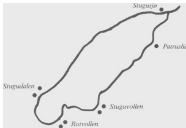
Midt på 1800-tallet var det blitt åtte gardsbruk ved Stugusjøen.