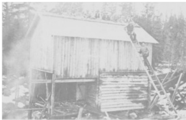
Taktekking i 1919 på kvernhuset ved Væla elv på Aune. Fire av Aune-gardene gikk sammen om bygginga, og kverna ble brukt i flomtida vår og høst.