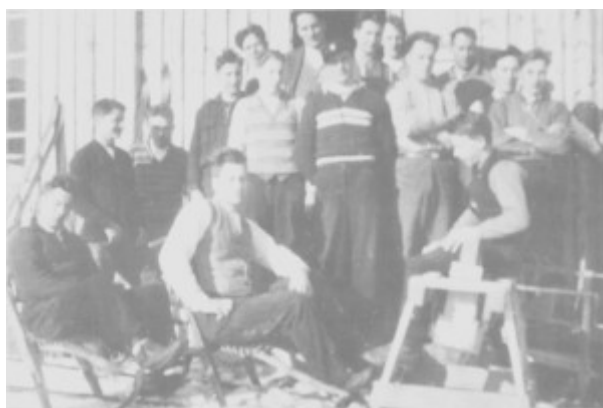
Arbeidsløs ungdom kunne bruke tida til å lære noe nyttig. Bildet er fra et snekkerkurs i Spongtun i i 934.

Vi må legge til at det var bare menn som ble registrert som arbeidsledige i mellomkrigstida i Tydal. Kvinner ble hverken registret som ledige eller fikk noen tilbud om sysselsetting. Gifte kvinner skulle forsørges av en mann, og det var nærmest umoralsk om begge hadde lønna arbeid. Ei gift kvinne på en arbeidsplass burde vike for mannlige arbeidsledige, mente nesten alle. Ei lærerinne f.eks. kunne rett og slett sies opp når ho gifta seg og fikk en forsørger. (1 Tydal hadde dette skjedd i 1909.)