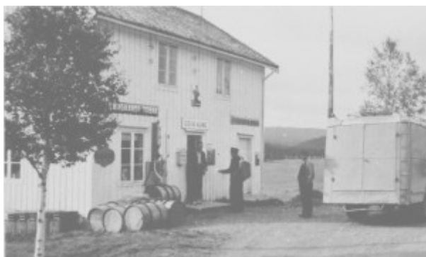
Odin Aune bygde opp en liten landhandel på Aune,