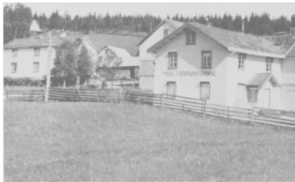
Bygninga til Tydal forbruksforening i Ås. Den ble senere kjent som Krysset kafé og pensjonat, og fra slutten av 1980-åra tilholdssted for ungdomsklubben.

Begge forretningene drev altså en mild politikk overfor kundene og strakk seg langt i ei tid da mange ikke hadde så mye arbeid og inntekter å leve av. Og Samvirkelaget strakk seg mye lenger enn NKL likte. Men krava derfra ble ikke fulgt opp av frykt for at en ville miste kunder. De kunne utnytte konkurransen mellom forretningene, og i praksis kom disse til å drive ei betydelig sosialhjelp. Forretningene praktiserte også en kundevennlig åpningstid. I slutten av 1930-åra ble det holdt åpent fra kl. 8.30 til kl. 19.00. Men lørdagen stenge butikkene kl. 18.00. Om sommeren åpna de én time tidligere på mandag og fredag, altså kl. 7.30. Arbeidstida for betjeninga var i samsvar med tariffavtaler 48 timer i uka. Trass i tap på enkelte kunder, gikk begge forretningne med sikre overskott. Samvirkelaget la seg opp kapital, og reservefondet passerte 30.000 kroner i 1938. Pengene gikk til nybygg etter krigen.