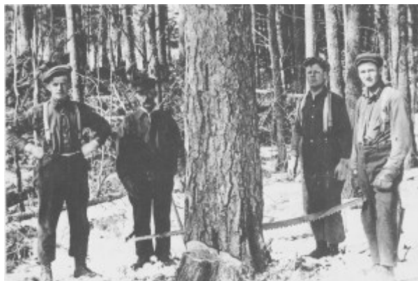
Tydalingene i Amerika satsa helst på arbeid de